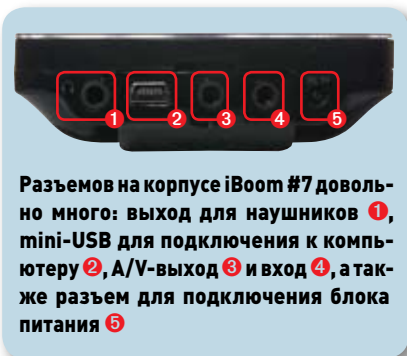
Разъемов на корпусе iBoom #7 довольно много: выход для наушников 1, mini-USB для подключения к компьютеру 2, A/V-выход 3 и вход 4, а также разъем для подключения блока питания 5

движущимися светлыми объектами тянулся синеватый шлейф, исчезающий примерно через секунду.